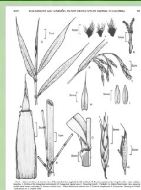
Otatea colombiana Ruiz-Sanchez & Londoño