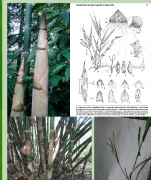
Guadua incana Londoño